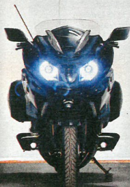
BMW K 1600 B